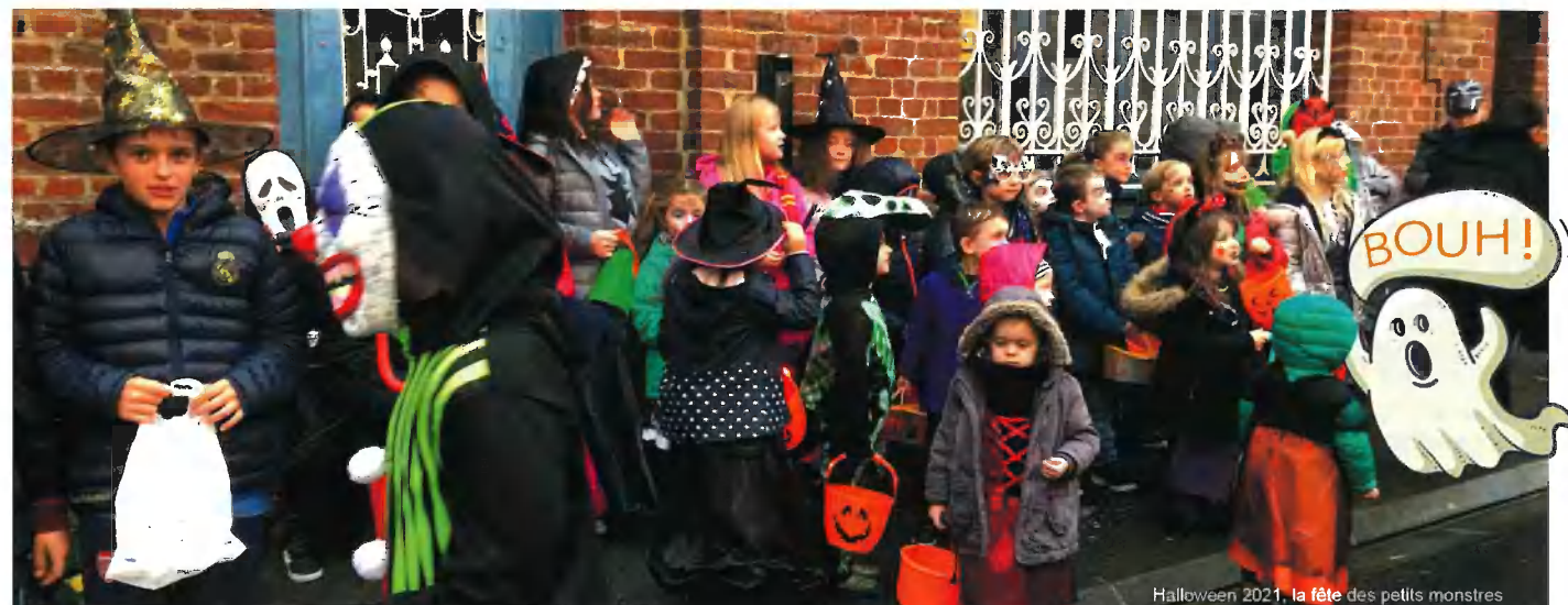
Halloween 2021, la fête des petits monstres

Cette année encore l'Association des Parents d'Élèves est plus motivée que jamais ! De nouveaux parents bénévoles de Sommaing et de Vendegies sont venus renforcer l'équipe et nous sommes désormais 18 membres actifs. De plus, nous pouvons compter sur d'autres parents qui proposent leur aide régulièrement et nous les remercions !