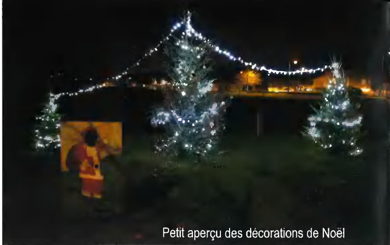
Petit aperçu des décorations de Noël