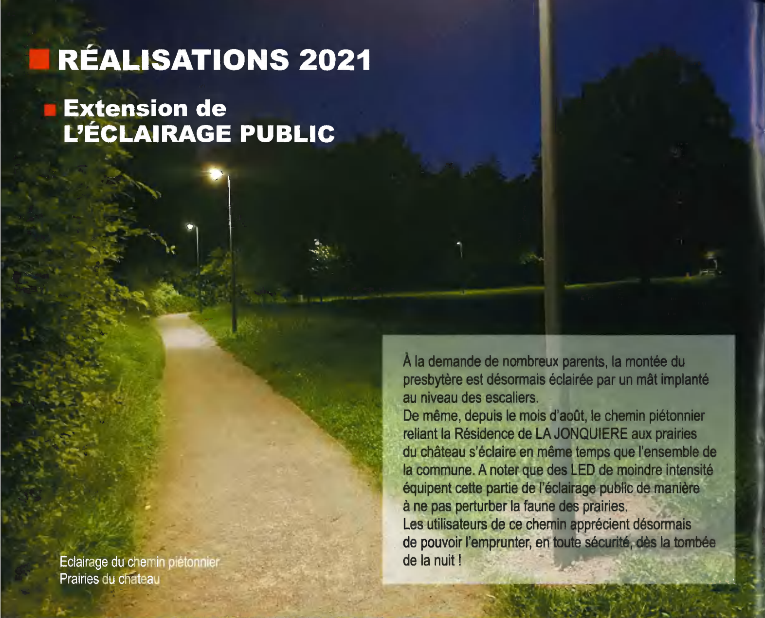
Eclairage du chemin piétonnier Prairies du château

À la demande de nombreux parents, la montée du presbytère est désormais éclairée par un mât implanté au niveau des escaliers. De même, depuis le mois d'août, le chemin piétonnier reliant la Résidence de LA JONQUIERE aux prairies du château s'éclaire en même temps que l'ensemble de la commune. A noter que des LED de moindre intensité équipent cette partie de l'éclairage public de manière à ne pas perturber la faune des prairies. Les utilisateurs de ce chemin apprécient désormais de pouvoir l'emprunter, en toute sécurité, dès la tombée de la nuit !