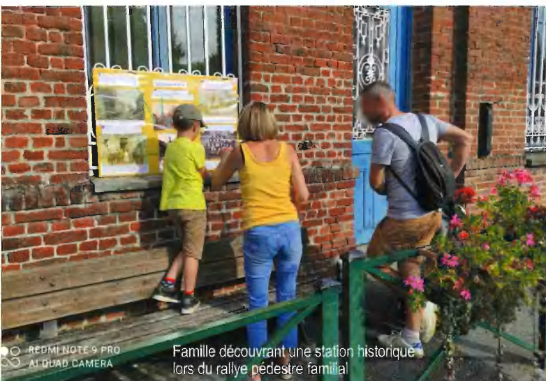
Famille découvrant une station historique lors du rallye pédestre familial